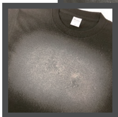
※写真のように大量に塗布します。