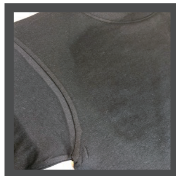
※プレス直後はプレス跡が残ります。