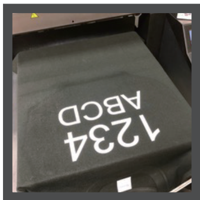
※印刷直後はインクが乾いていません。