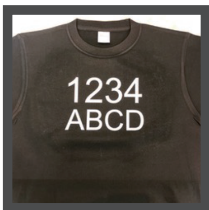
※180度の高温で再度アイロンプレスをしてインクを乾かします。これで完成です。